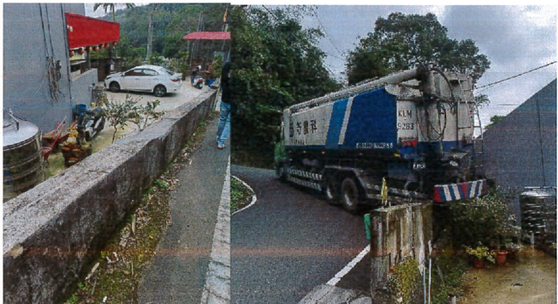
圖 3 大車轉彎困難卡到安全圍籬

(三) 另請新農科技股份有限公司向下包廠商加強宣導，儘量改以小型車輛進出，避免因不熟悉路況致損壞周邊安全圍牆。