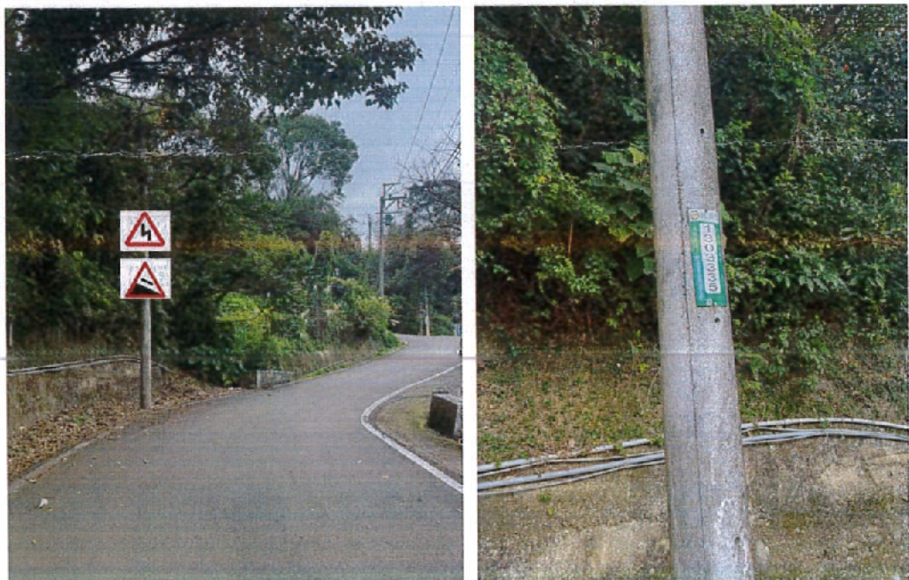
圖 1 路燈桿編號 1303335 設置三角型連續彎路標誌及險升坡標誌 2 面

(二)另由本市蘆竹區公所於草仔崎路路段 2 處（路燈桿編號 1303335 及電信桿編號草仔枝 36 分 8）設置三角型連續彎路標誌及險升坡標誌各 2 面（設置位置詳示意圖），以加強用路人行車警示。