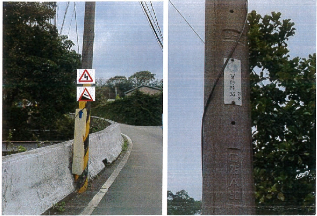
圖 2 電信桿編號草仔枝 36 分 8 設置三角型連續彎路標誌及險升坡標誌 2 面

(三) 另請新農科技股份有限公司向下包廠商加強宣導，儘量改以小型車輛進出，避免因不熟悉路況致損壞周邊安全圍牆。