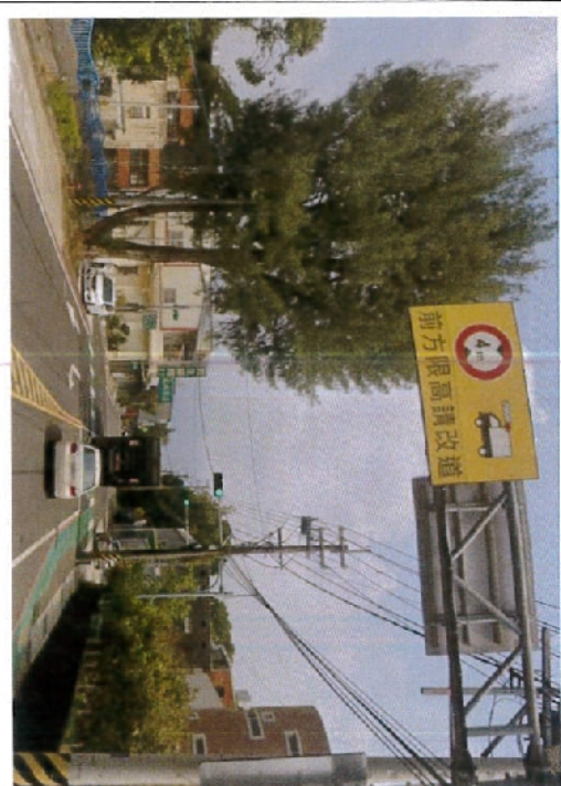
4. 楊新路一段-水美國小