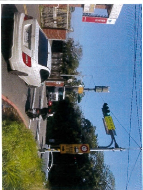
2. 金華街與楊新路一段