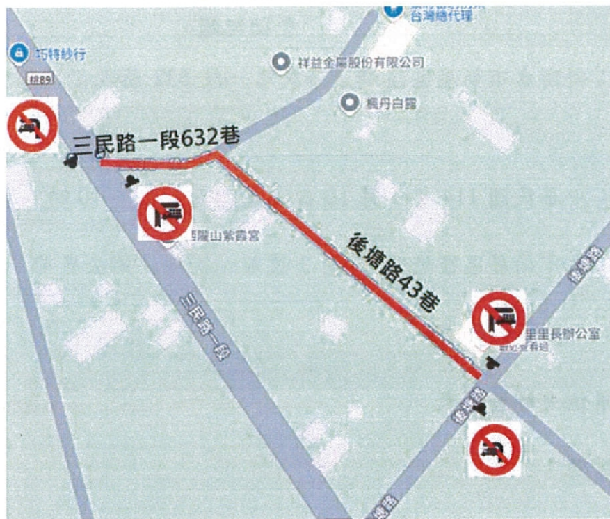
圖 2 本案禁行路線起迄點示意圖