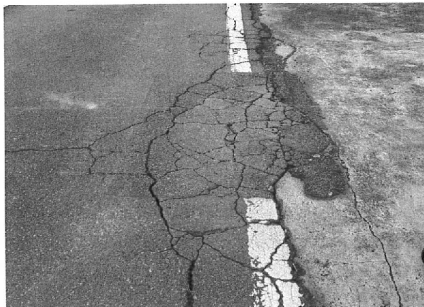
圖 1 新屋區後塘路 43 巷禁行路段道路損傷現況

經現場會勘與會人員討論，新屋區後湖里三民路一段 632 巷及後塘路 43 巷現非大貨車管制通行路段，惟考量該巷道內無工廠非必要經過路段，尚有部分大型車輛行駛上述路段致嚴重壓壞道路(參照圖 1)，影響當地居民出入安全，爰決議將該路段增設為大貨車管制通行路段，禁止 20 噸以上（包含 20 噸）大貨車通行，大貨車禁行路段請參照圖 2。