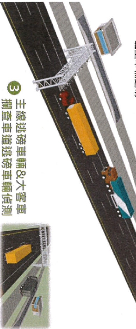
3 主線逃磅車輛&大客車 攔查車道逃磅車輛偵測 針對應入磅而未入磅之車輛，逕行拍照舉證

2 資訊可變標誌 無超載疑慮車輛車號顯示於 資訊可變標誌上，可直接自 主線通過無須入磅