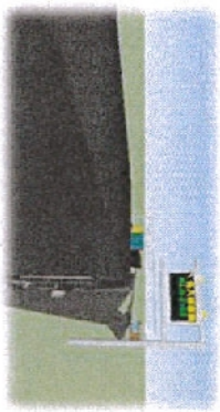
4 地磅站出口資訊可變標誌 再次顯示無超載疑慮車輛車號， 可自大客車攔查車道通過無須入磅