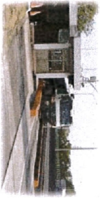
5 靜態地磅 載重車輛過磅