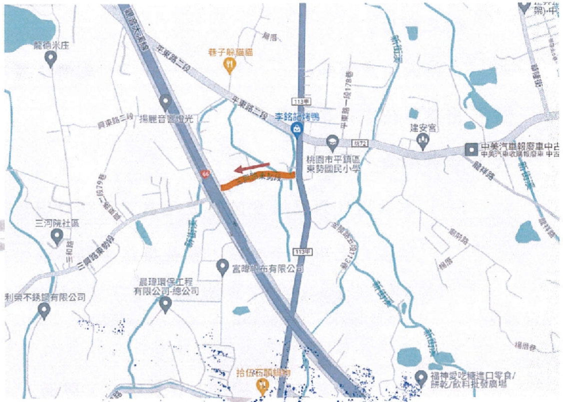
大貨車禁行路段示意圖