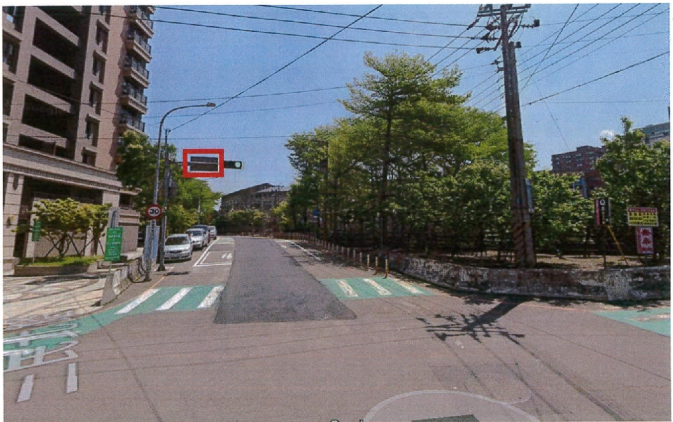
圖 2.1 牌面設置處