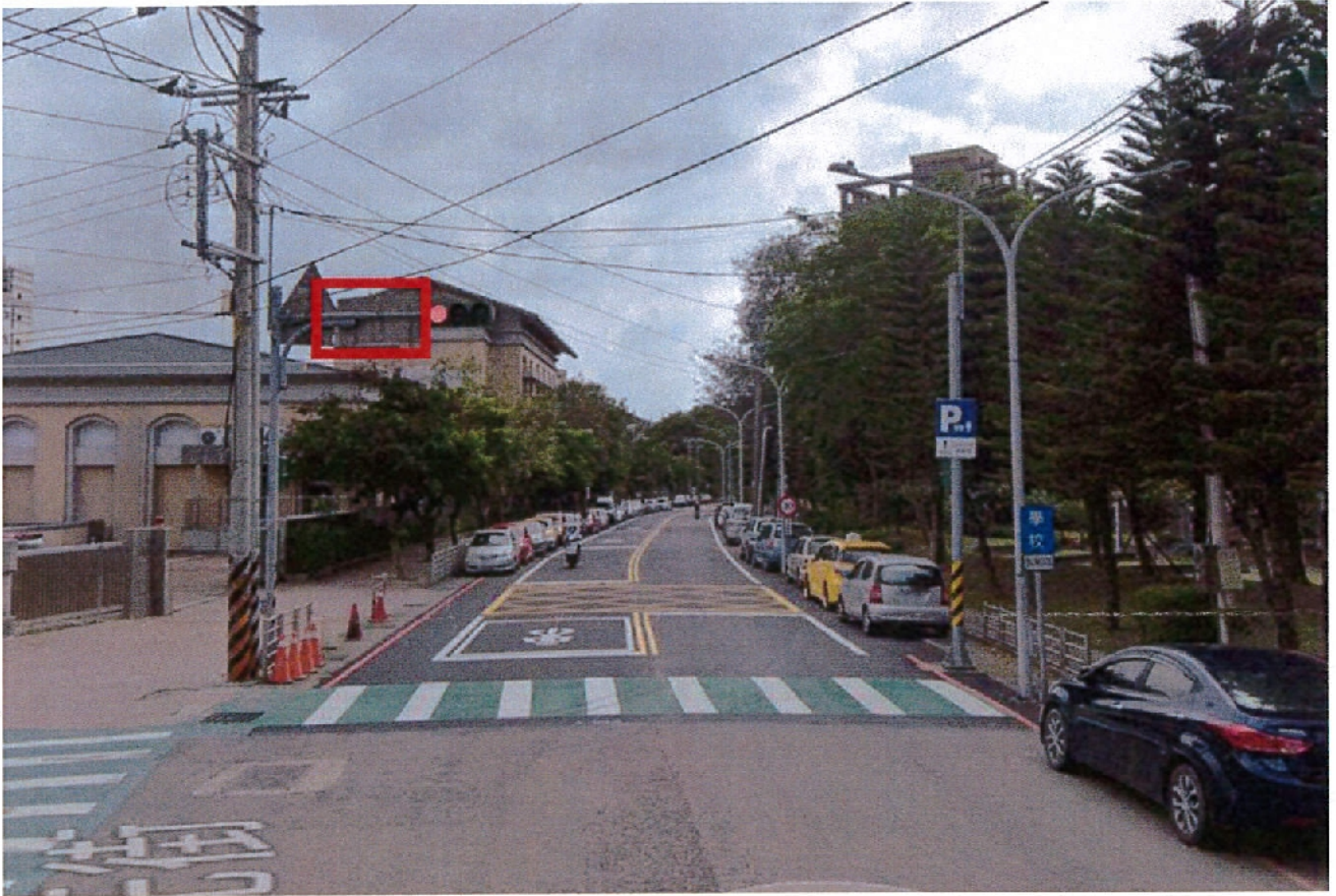
圖 2.2 牌面設置處