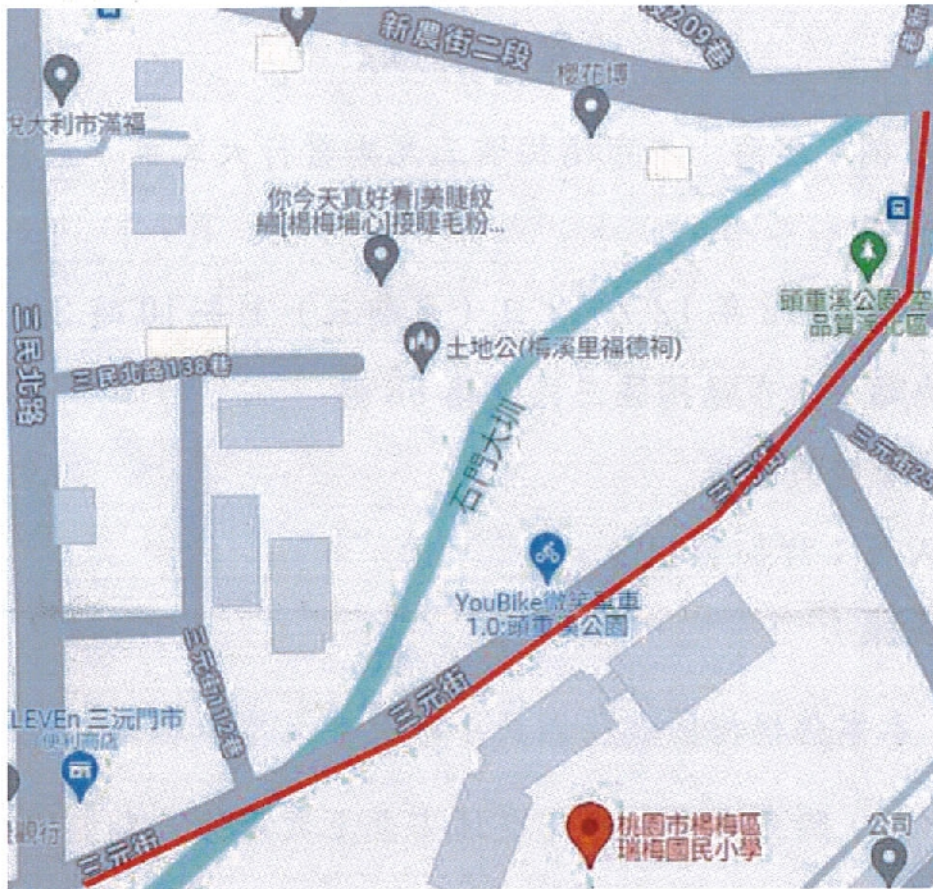
圖 1 禁止路段