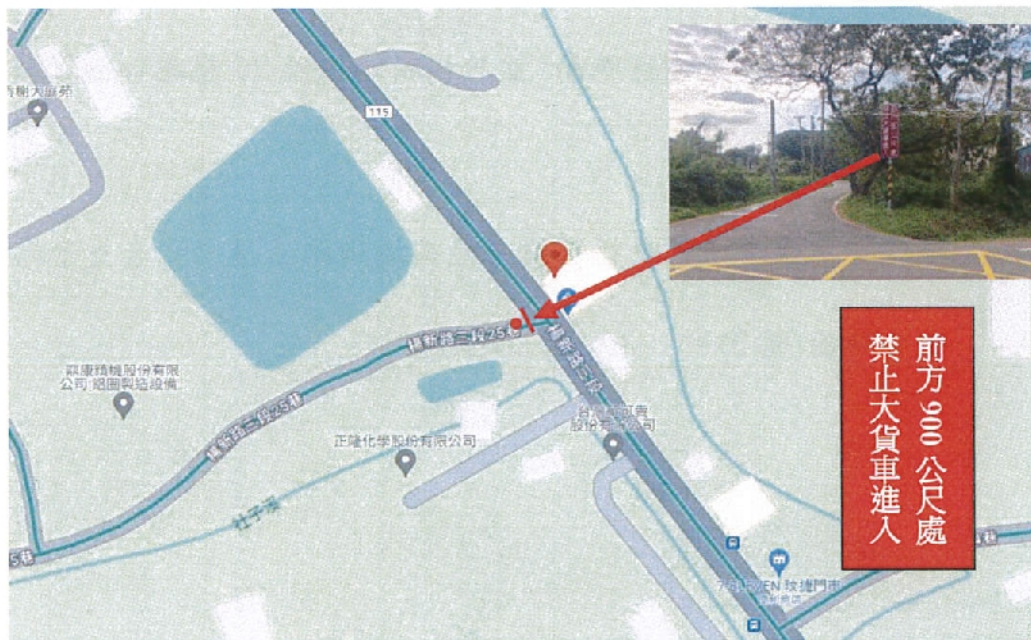
圖 2 預計拆除牌面