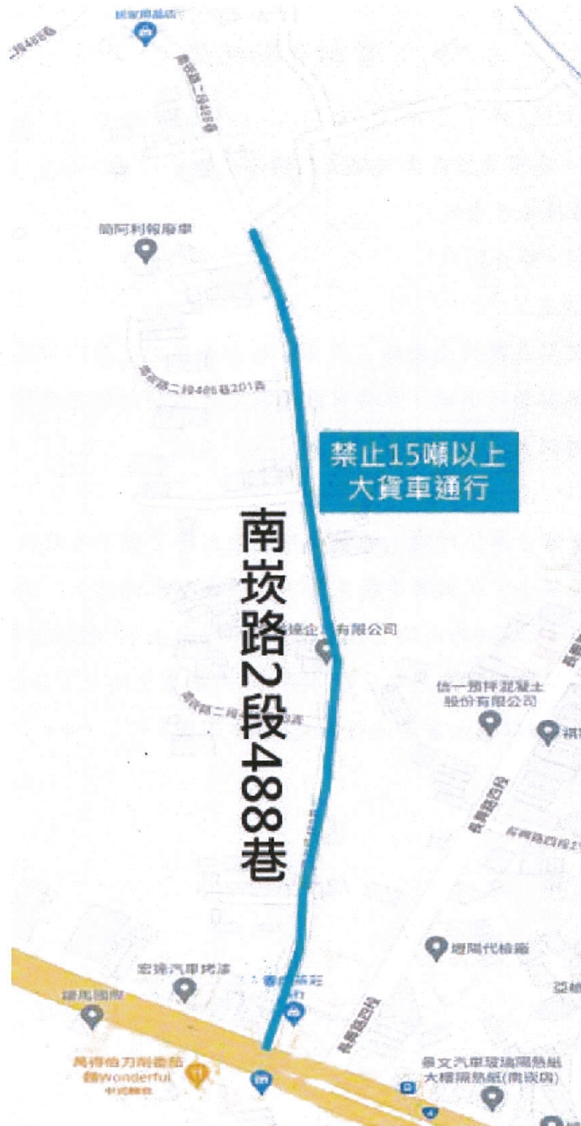
figure 1 大貨車禁行範圍